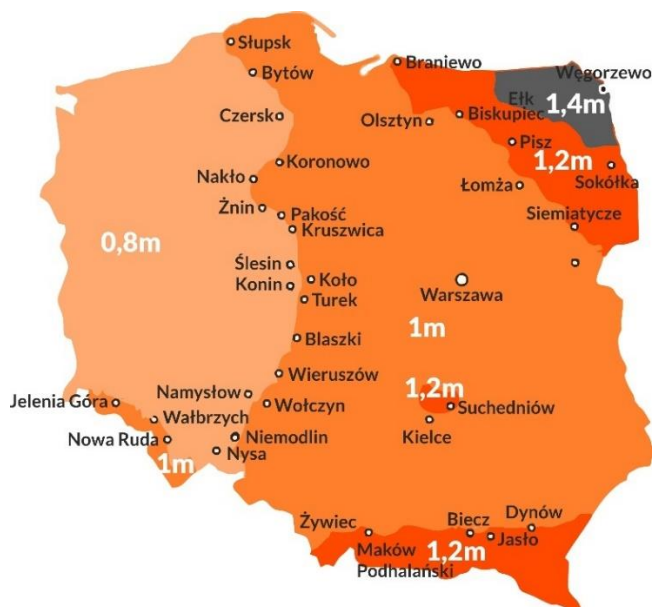
Rys. 1. Głębokość przemarzania gruntu wg PN-81/B-03020

W wypadku, gdy w podłożu występują grunty wysadzinowe lub wątpliwe, należy sprawdzić, czy rzeczywista grubość wszystkich warstw zaprojektowanej konstrukcji nie jest mniejsza niż 0,4 h, gdzie h oznacza głębokość przemarzania gruntów w rejonie projektowanej konstrukcji (Rys.1). Jeżeli warunek ten nie jest spełniony, to pod konstrukcją należy wykonać warstwę mrozoochronną o grubości zapewniającej spełnienie tego warunku.