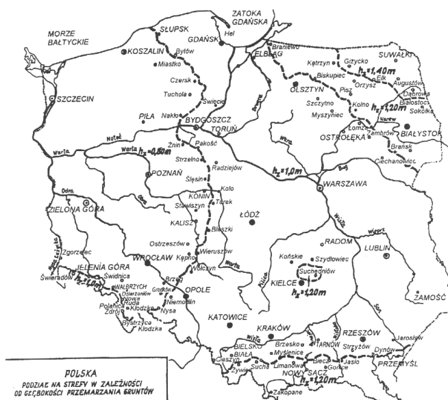
Rys. 1. Głębokość przemarzania gruntu wg PN-81/B-03020

W wypadku, gdy w podłożu występują grunty wysadzinowe lub wątpliwe, należy sprawdzić, czy rzeczywista grubość wszystkich warstw zaprojektowanej konstrukcji nie jest mniejsza niż 0,4 h_z , gdzie h_z oznacza głębokość przemarzania gruntów w rejonie projektowanej konstrukcji (Rys.1). Jeżeli warunek ten nie jest spełniony, to pod konstrukcją należy wykonać warstwę mrozoochronną o grubości zapewniającej spełnienie tego warunku.